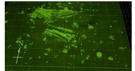
▲海底の戦艦「大和」 平成28(2016)年、呉市による潜水調査をもとに作成したCG画像。