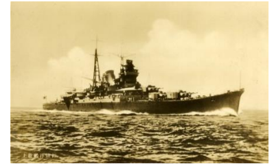
▲巡洋艦「最上」 呉でつくられた船です。山形県の「最上川」から名前がとられています。

広島県は江戸時代まで、「安芸国」「備後国」と呼ばれていましたが、この昔の呼び名を旧国名といいます。「大和」は、現在の奈良県の旧国名です。